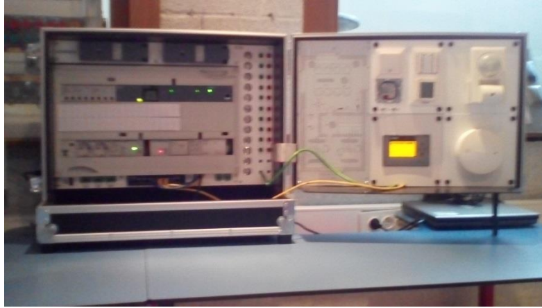
Valisette automate KNX